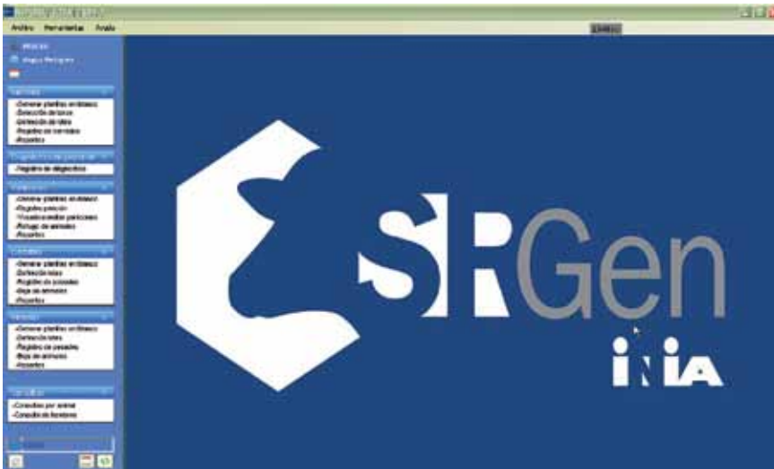
Ilustración 1 - SRGen: software generado por INIA para facilitar el registro de los eventos del rodeo

por lo que presentan heredabilidades bajas. Ello determina menores progresos genéticos potenciales al seleccionar por ellas. Según Garrick (2005) estos últimos factores constituyeron los principales motivos por los que programas de mejoramiento en bovinos en todo el mundo se centraron primero en características de crecimiento, antes que en las reproductivas.